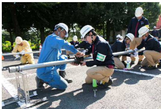
② ガス漏洩調査・応急修理訓練