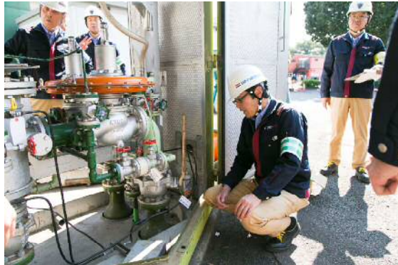
③ ガス整圧器操作停止訓練