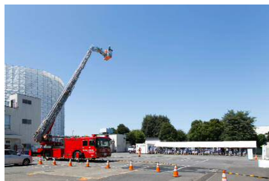
⑥ 高所建物救助訓練