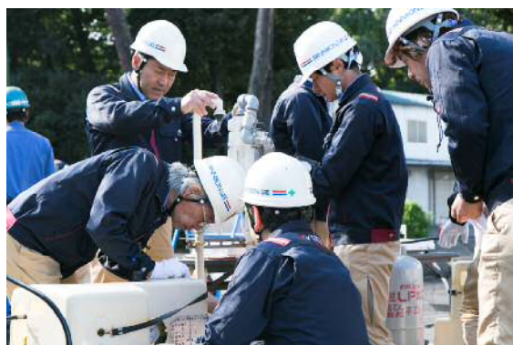
① 移動式ガス発生設備設置訓練